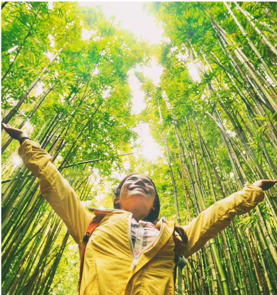
5 Bộ Quy tắc Ứng xử trong Kinh doanh dành cho Nhà cung cấp

Chúng tôi kỳ vọng các nhà cung cấp của mình cũng làm như vậy theo các nguyên tắc cốt lõi sau đây.